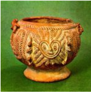
“Cocina de Brujo” con representaciones de lechuza y felino. (Museo del Banco Central de Guayaquil)