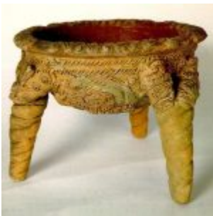
Cuenca trípode con representaciones de culebras. Museo Arqueológico Banco del Pacífico

Vasija llamada «Cocina de Brujo», en la que se puede apreciar una abigarrada conjunción de figuras humanas y de animales. Al igual que la mayoría de las culturas que habitaron los territorios del Ecuador actual, la Milagro-Quevedo desarrolló interesantes técnicas para el cocido del barro, con el que elaboraban una gran variedad de utensilios ceremoniales y para el uso diario.