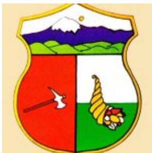
Escudo de la Provincia de Bolívar