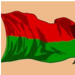
Bandera de la Provincia de Bolívar