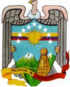
Escudo de la Provincia del Pichincha